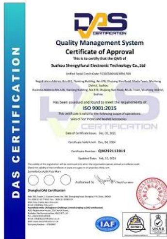
2023 ISO Certificate