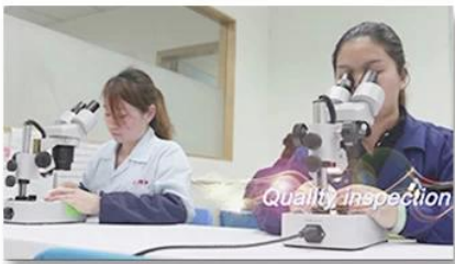
4. Quality inspection