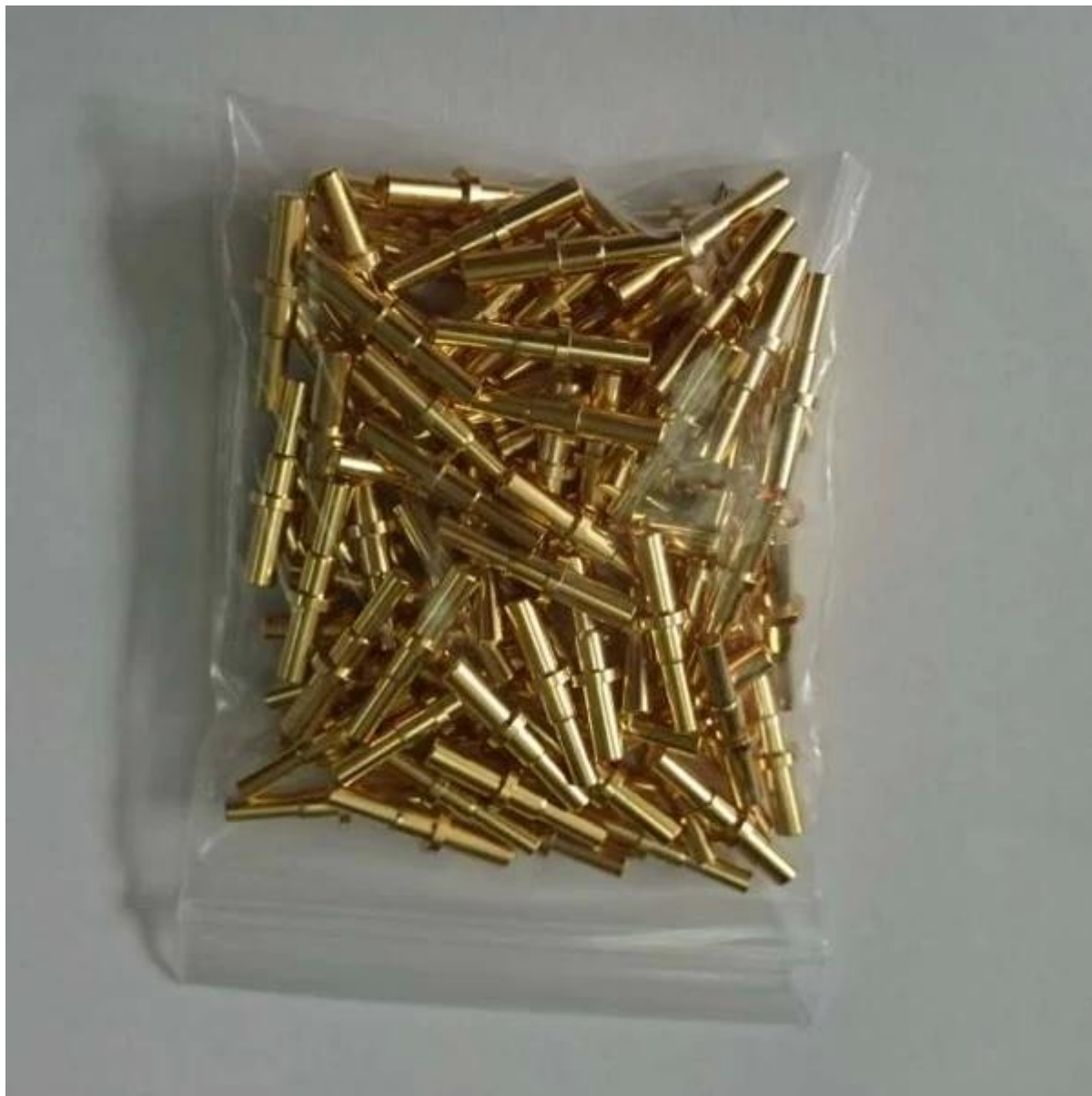
Батарея пого контактный разъем способ упаковки