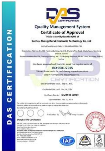
2023 ISO Certificate