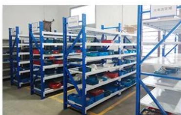
5. Finished products