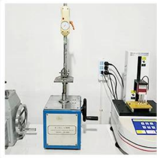
4. Bond Test