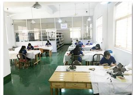
3. Assemble workshop