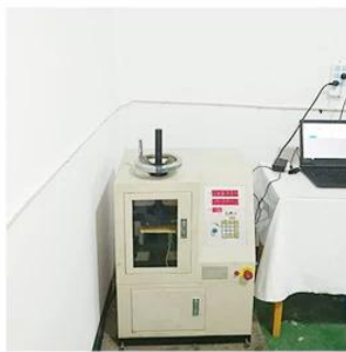
5. Life Fatigue Test