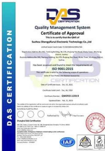
2023 ISO Certificate