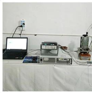
1. Agilent current testing