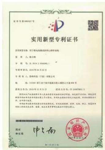
Patent for Coaxial Structure