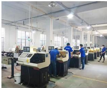
2. Lathe workshop