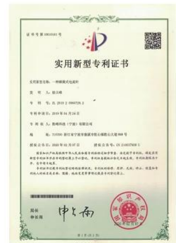
Patent for Honeycomb current probe