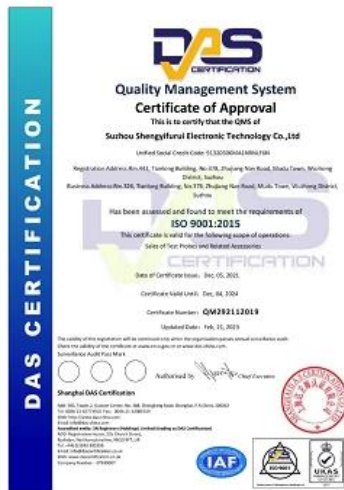
2023 ISO Certificate