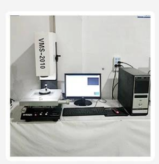
2. Quadratic element