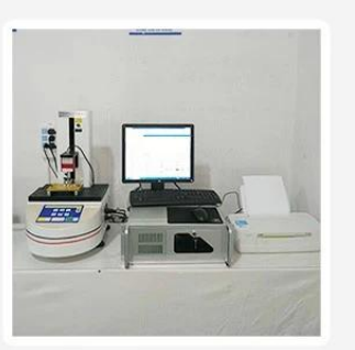
3.Load Curve Meter