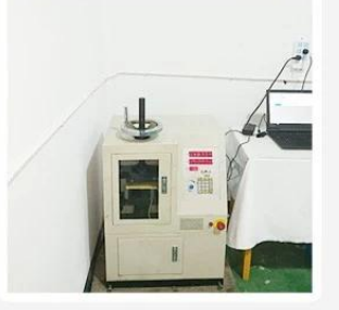
5.Life Fatigue Test