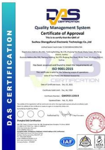
2023 ISO Certificate