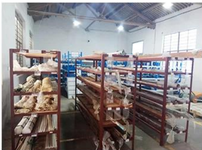
1. Raw material warehouse