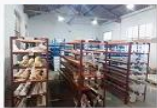
1. raw material warehouse