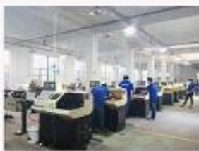
2. Lathe workshop