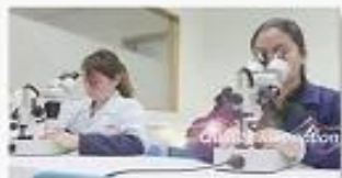
4. Quality inspection