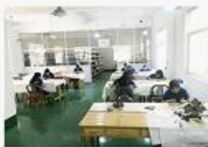
3. Assemble workshop